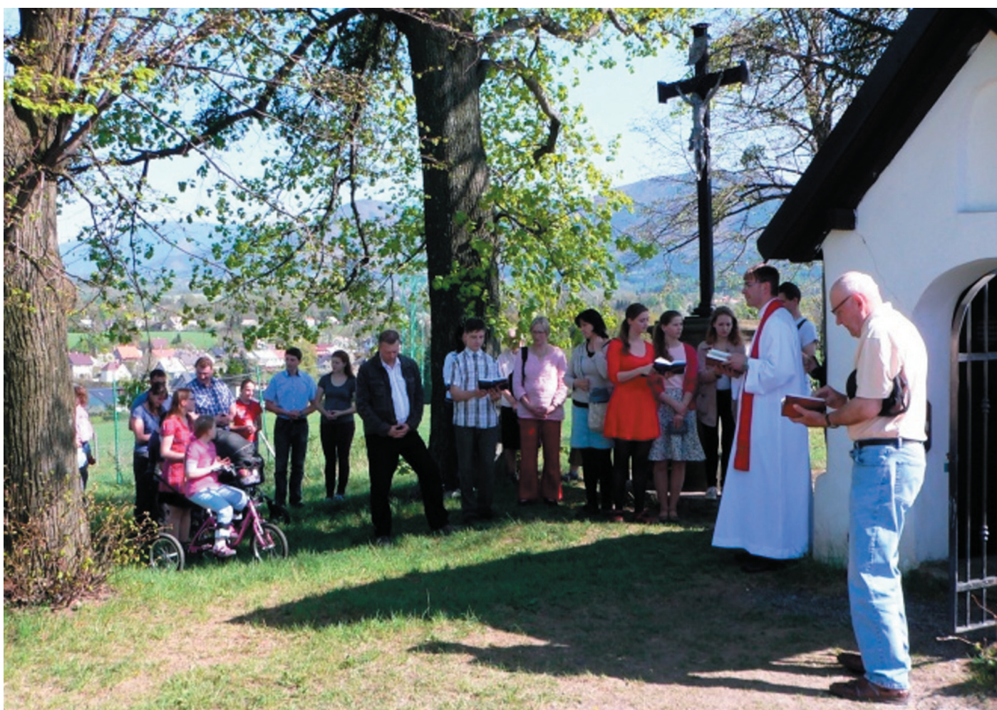
Pobožnost u kaple sv. Marka dne 22. dubna 2018