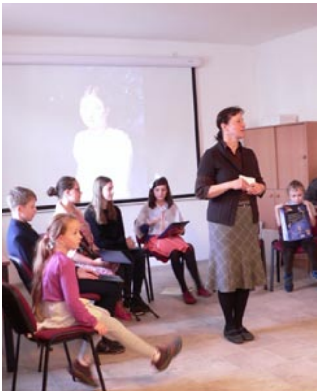
Misijní neděle, 30. října 2022