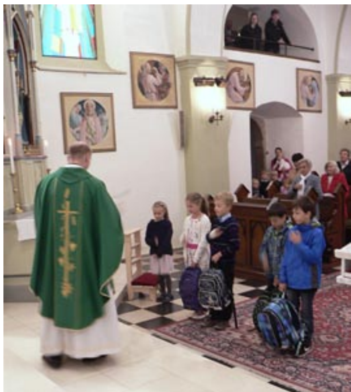
Žehnání aktovek, 4. září 2022