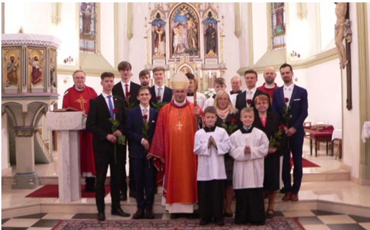
Bířmování, 4. listopadu 2022