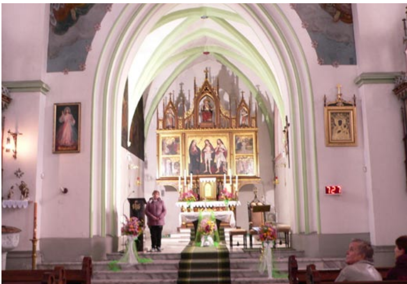
Kostel Narození Panny Marie v Orlové (z pouti do Turzy Śląskiej), 15. října 2022