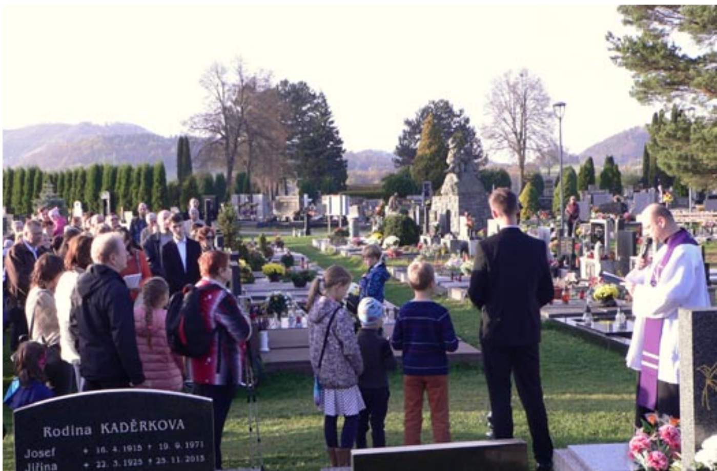
Dušičková pobožnost, 30. října 2022