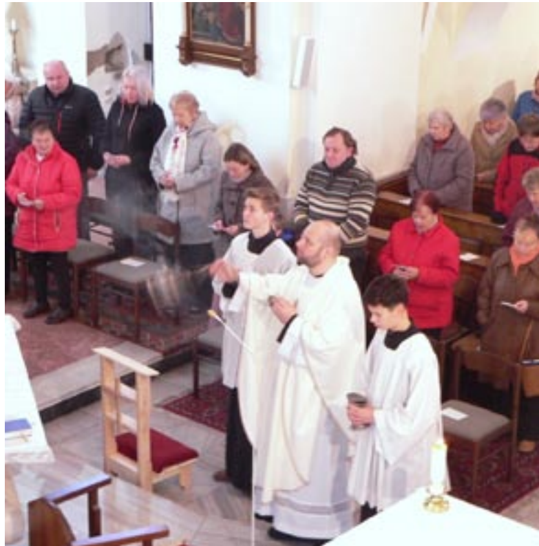
Oslava patronie sv. Martina, 13. listopadu 2022