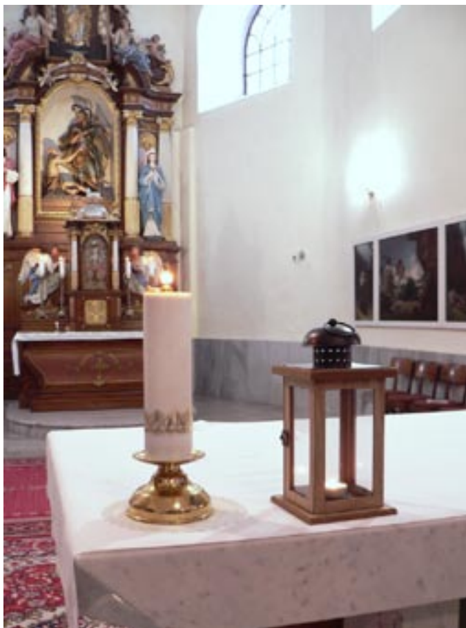
Betlémské světlo, 18. prosince 2022