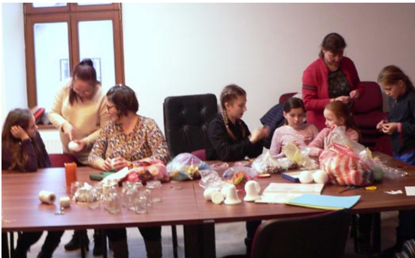
Příprava na misijní jarmark, 3. prosince 2022