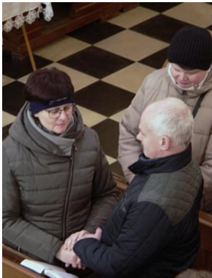
Obnova manželských slibů, 30. prosince 2022