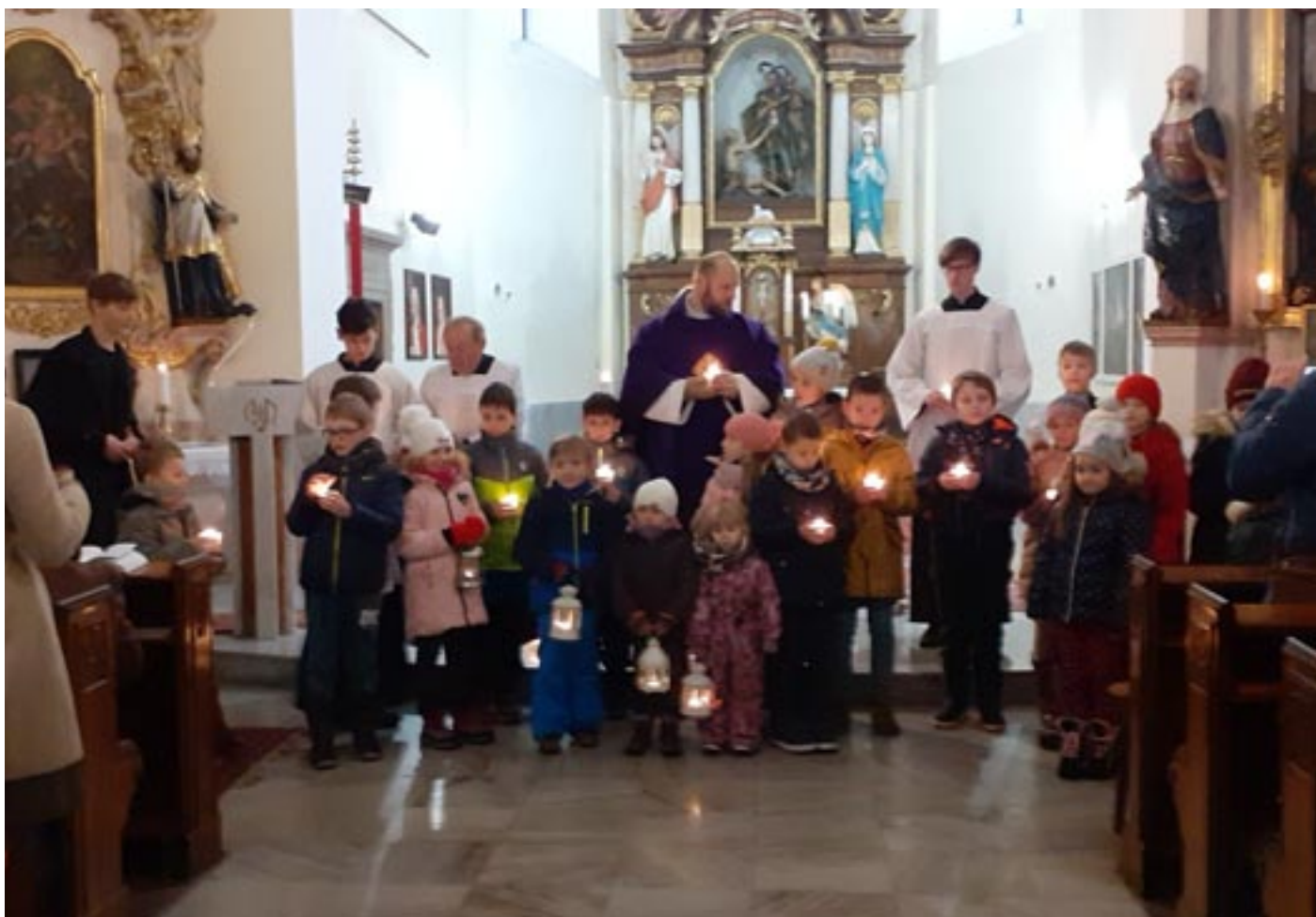
Roráty, 17. prosince 2022